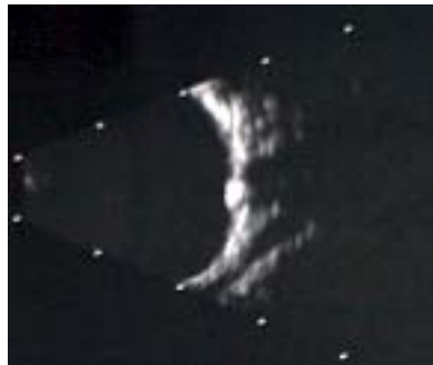
Ultrasound démontrant un large drusen

Les drusen du nerf optique peuvent être enfouis dans la substance de la papille optique ou être situés superficiellement à la surface de la papille. Lorsque les drusen sont superficiels, ils apparaissent comme des corps jaunâtres brillants juste en dessous de la surface de la papille optique, facilement visualisés lors de l'examen du fond d'œil. Lorsque les drusen sont enfouis profondément dans la papille optique, ils deviennent difficiles à visualiser avec l'ophtalmoscope, mais peuvent être identifiés avec un appareil à ultrasons.