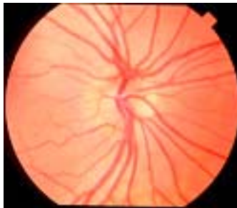
Embranchements multiples des vaisseaux sanguins

Les drusen du nerf optique sont habituellement invisibles à la naissance et sont rarement retrouvés chez les nourrissons et les enfants. Les drusen se développent lentement au cours du temps, secondaire à l'accumulation et calcification de matériel anormal dans la papille optique. L'âge moyen auquel les drusen sont visibles est de 12 ans. Souvent, la papille optique a une apparence inhabituelle avec de multiples embranchements des vaisseaux sanguins majeurs à leur émergence de la papille optique.