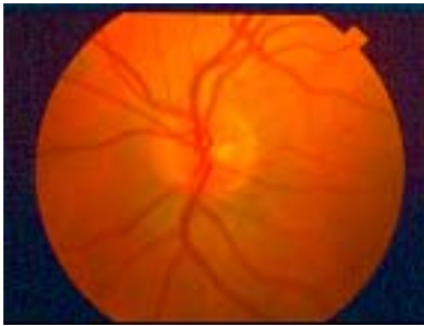
Papille optique normale

Votre médecin vous a diagnostiqué avec des drusen du nerf optique. Ces drusen (ou druses) représentent des dépôts anormaux de matériel protéinique au niveau de la papille optique – la partie antérieure du nerf optique. La cause exacte de leur présence reste inconnue. On pense que les drusen du nerf optique résultent d'une anomalie du flux de matériel dans les cellules du nerf optique.