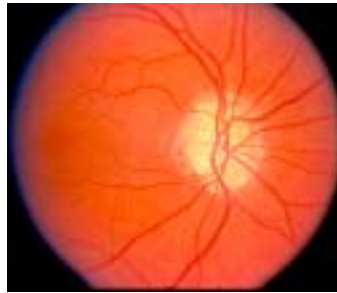
Apparence bosselée des drusen de la papille