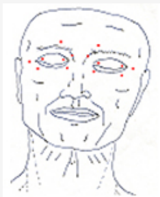
נקודות להזרקת בוטוקס