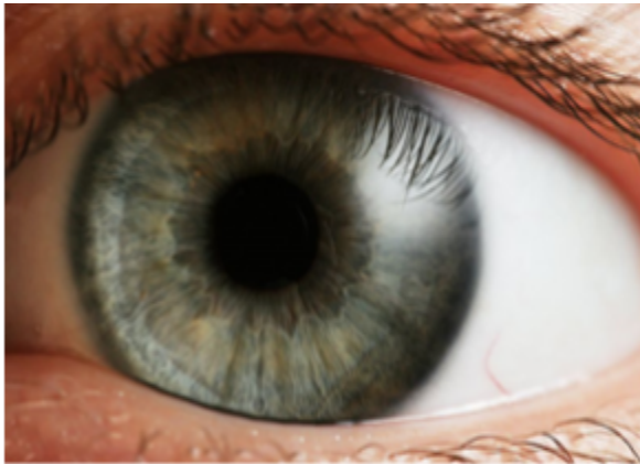
Figura 1. La pérdida visual transitoria puede proceder de un problema en el ojo, los nervios que controlan la visión, o del cerebro. La valoración por un oftalmólogo es necesaria para determinar la causa y el tratamiento. Imagen licenciada bajo la licencia Creative Commons Attribution-Share Alike 2.5 Generic .

Pérdida visual transitoria es el término usado para describir la pérdida total o parcial de la visión en uno o ambos ojos temporalmente. Algunas personas no experimentan una pérdida completa