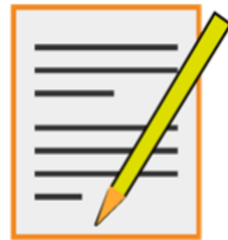
Figura 3. Escriba los detalles de los episodios de pérdida visual que puedan ayudar a su doctor a establecer las posibles causas.